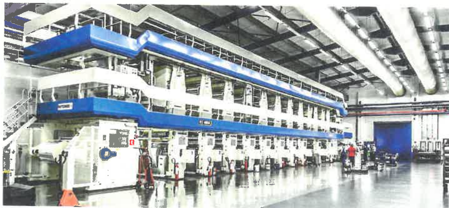
Zur Maschinenausstattung der griechischen Verpackungshersteller gehört eine Rotomec RS 4004 Tiefdruckanlage

So wundert es nicht, dass hochwertige Verpackungen für die Lebensmittel- und