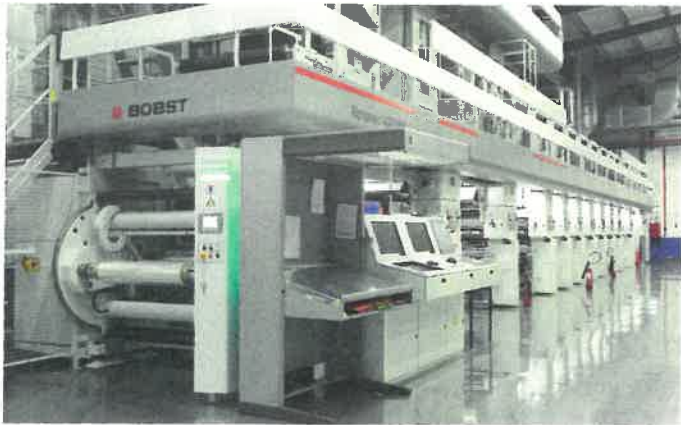
Eine Rotomec 4003MP rundet den Maschinenpark ab