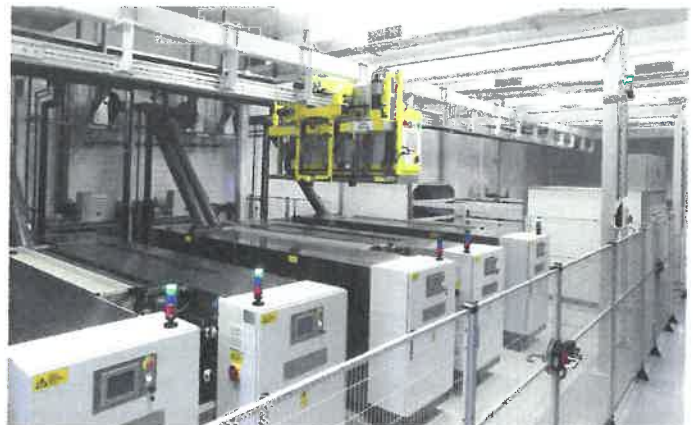
Hatzopoulos verfügt außerdem über zwei Flexodruckanlagen

Pharmaindustrie die wichtigsten Produkte der Helenen sind. In diesem Bereich erwarten die Kunden Verpackungslösungen, die einen hohen Schutz des Inhalts bieten – dies sind in der Regel doppel- und dreilagige Verbunde und Materialien, die wenig oder kein Licht durchlassen sowie sterilisierbare Folien.