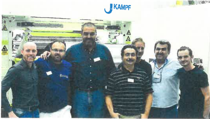
Vor wenigen Wochen war ein Team von Hatzopoulos zur Maschinenabnahme bei KAMPF in Wiehl zu Gast