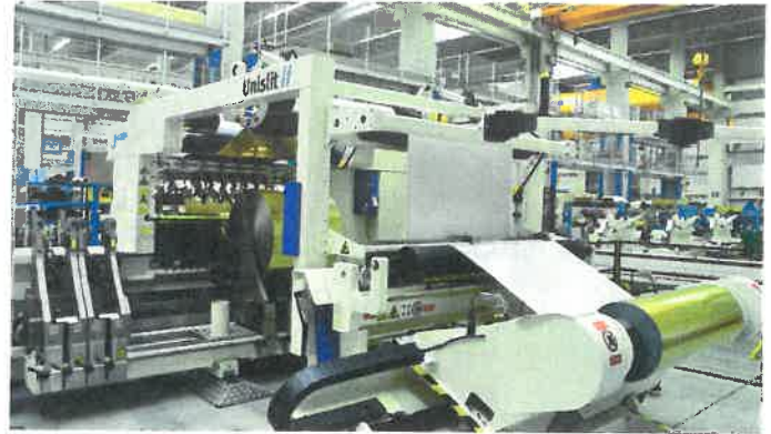
Hatzopoulos setzt beim Schneiden und Wickeln auf Maschinen von KAMPF und arbeitet u.a. mit einer Unislit

Programm „Active and biodegradable multilayer structure for dehydrated or dried food packaging applications“ (BIOACTIVELAYER), das darauf abzielt, biologisch abbaubare Verpackungen für getrocknete Lebensmittel zu entwickeln.