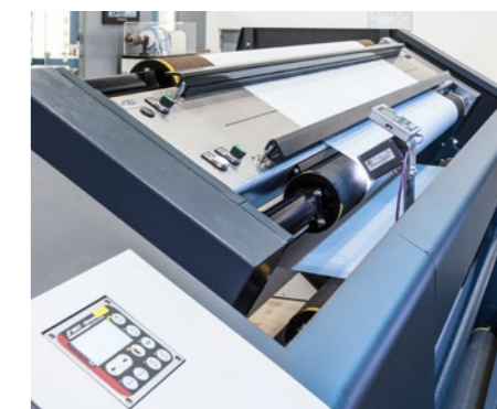
接料台 高质量的接料台使操作更简便。