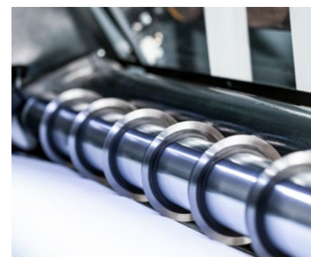
剪刀分切 最佳质量、长使用寿命。